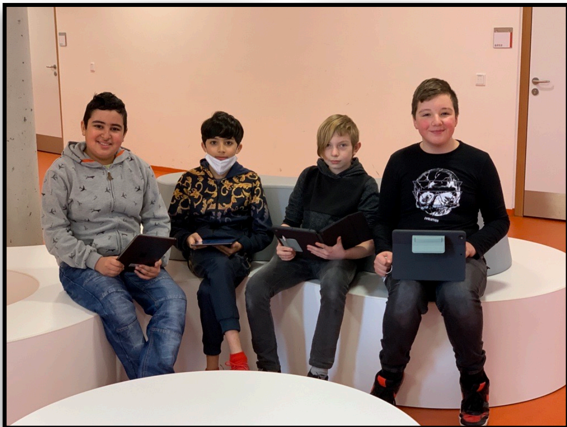
Gruppenarbeit mit den iPads